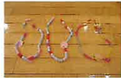
ストローのネックレス