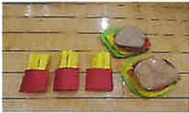
ポテトとハンバーガー