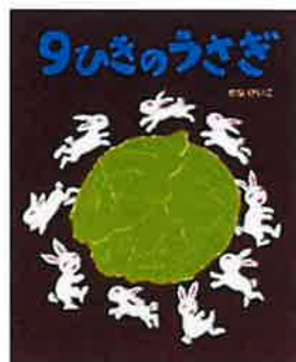
「おばけのてんぷら」 「9ひきのうさぎ」 作・絵 セナ けいこ (福音館書)