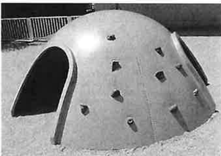
・ドキドキクライミング