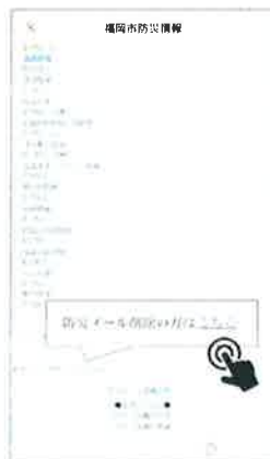
③ 削除の方は「こちら」を選択