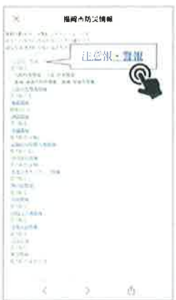
③ 変更したい情報を選択 ※上記は「注意報・警報」を変更する例