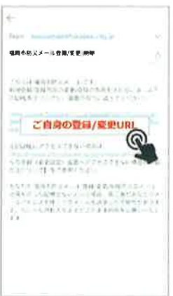
② 返信メールに記載されたURLをクリック