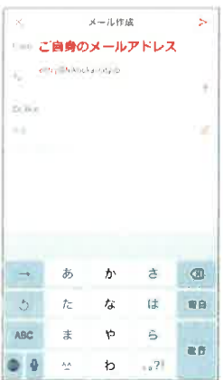
① entry@fukuoka-city.jp へ空メールを送信

初回登録時は共通の受信設定となっているため、ご自身の利用目的にあわせて受信設定を変更してください。