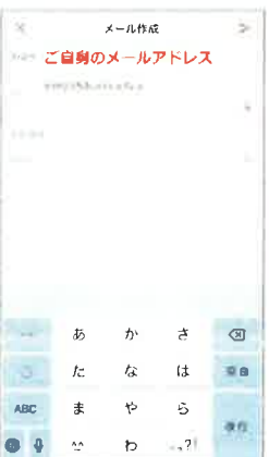
① entry@fukuoka-city.jp へ空メールを送信

市外への転出等で防災メールが不要となった場合は、以下の手順にて登録を削除できます。