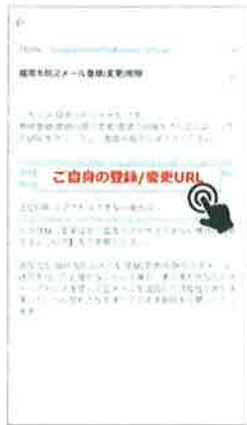
② 返信メールに記載されたURLをクリック