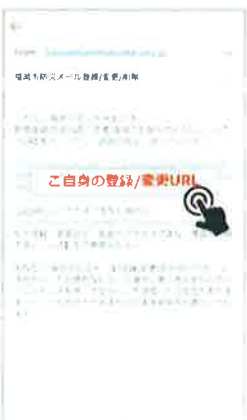
② 返信メールに記載されたURLをクリック