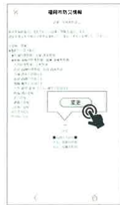
④ 受信したい情報をチェックし、変更ボタンを押下