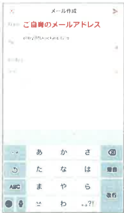
① entry@fukuoka-city.jp へ空メールを送信

携帯電話やスマートフォンから、 entry@fukuoka-city.jp へ空メールを送信すると、 bousaimail@fukuoka-city.jp からメールが届きます。このメールに記載された登録・変更用のURLをクリックすると登録完了です。